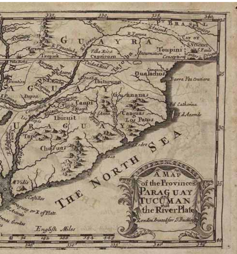
Mapa del Río de la Plata aparecido en la edición de 1698.